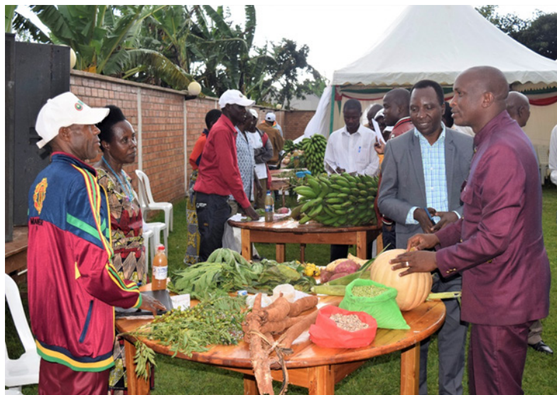
Le Gouverneur de la province Ngozi (1er à droite) en train de suivre les explications de l'un des couples qui a participé au concours