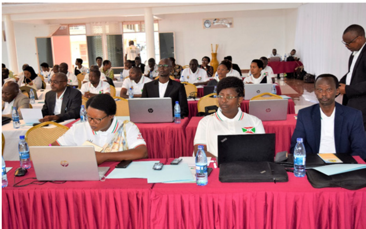
Les participants à cet atelier ont formulé des recommandations avant de se séparer

Il est très urgent de mettre en place l'assurance maladie obligatoire compte tenu du faible nombre de burundais qui ont accès à une assurance maladie. Cela ressort d'un atelier de lancement de la semaine dédiée à la protection sociale et à la mutualité de santé organisé au chef-lieu de la province Ngozi en date du 3 novembre 2022. Au cours de cet atelier, les participants ont recommandé d'accélérer le processus de mise en place de tous les préalables nécessaires pour rendre obligatoire l'assurance maladie.