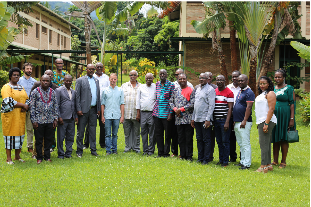
Les participants à cet atelier se sont engagés à contribuer dans la protection du sol