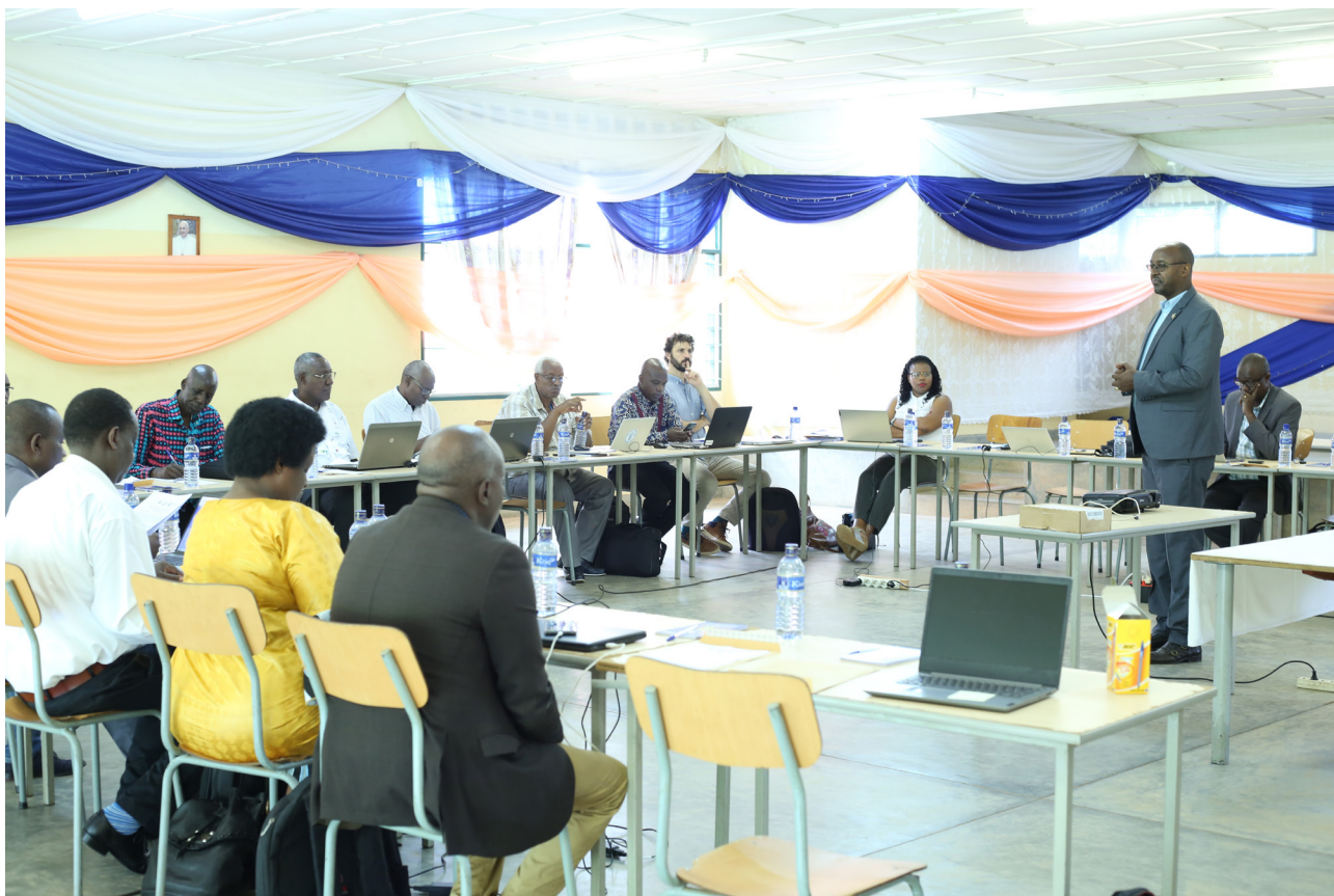
Les différents intervenants ont relevé que des efforts sont consentis sur le terrain en l'absence de toute coordination