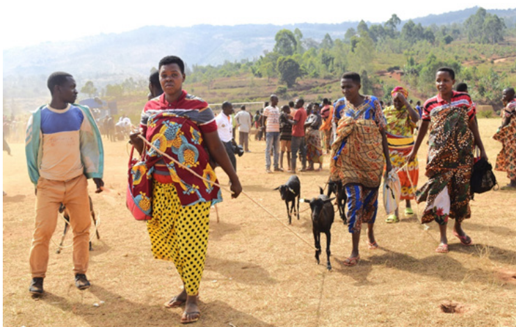
Parmi les bénéficiaires figurent des femmes provenant de différentes collines

puissent bénéficier de cet accompagnement dont les résultats ne sont pas à démontrer.