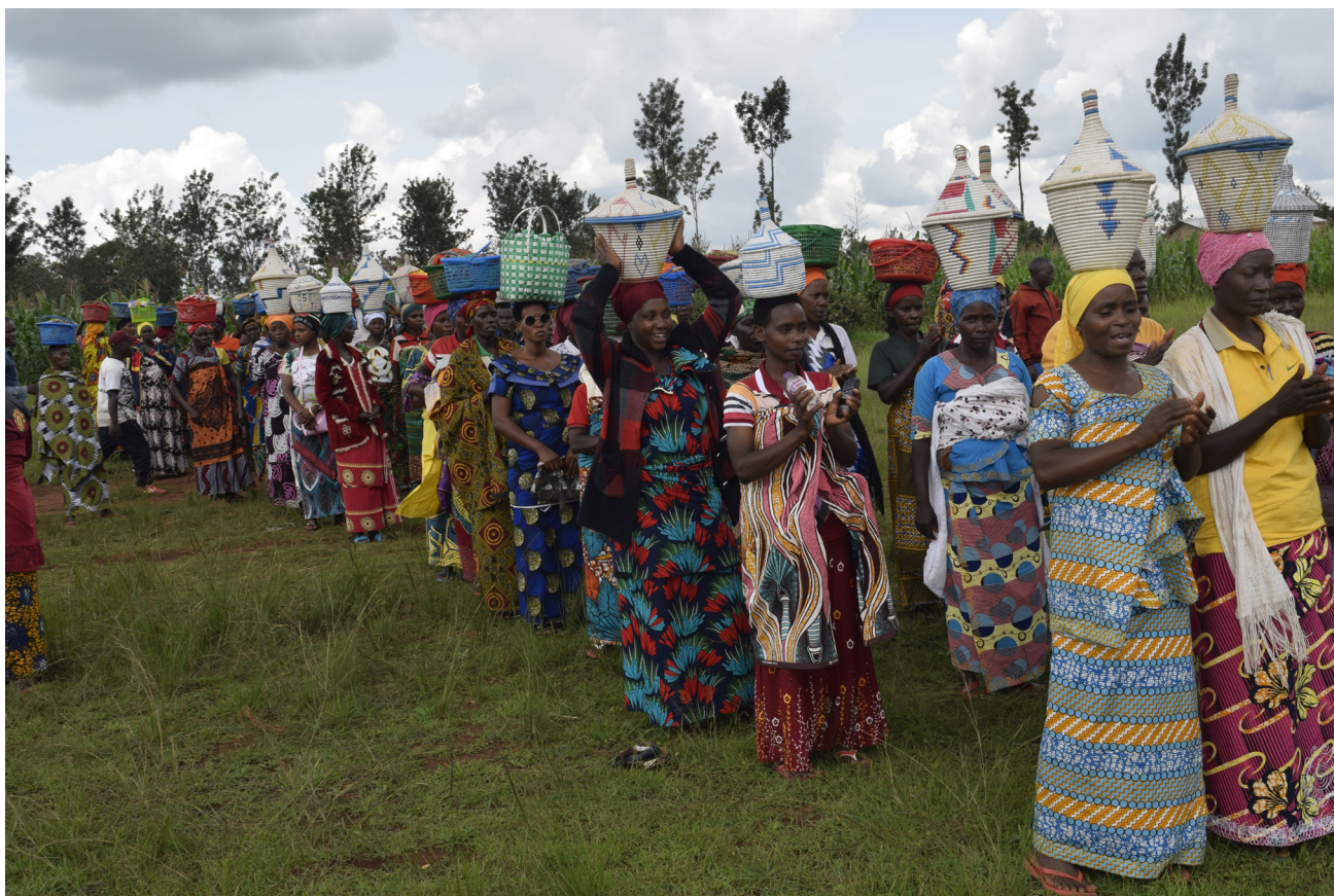
Des groupements d'ancrage à la base organisent des journées de solidarité pour les membres qui ont eu des naissances

de bananes et je pratique aussi la culture d'oignons. Tout ça me procure de l'argent et la base de tout c'est le fait que j'ai adhéré à une mutuelle de santé ».