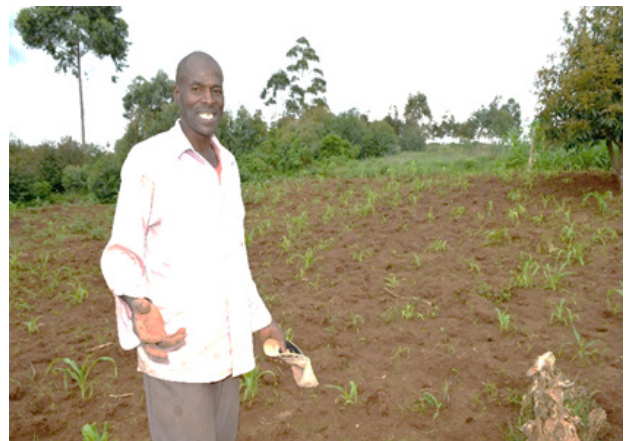
A un certain moment, la fumure organique lui a fait défaut et il a fait recours à l'engrais chimique. Voilà à quoi ressemblait un autre champ de maïs au moment de notre passage