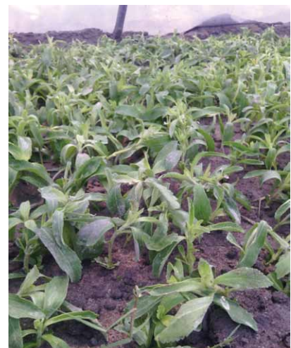
Aspect des semences