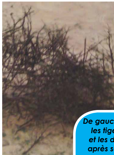
De gauche à droite, les tiges sèches et les des feuilles après séparation.