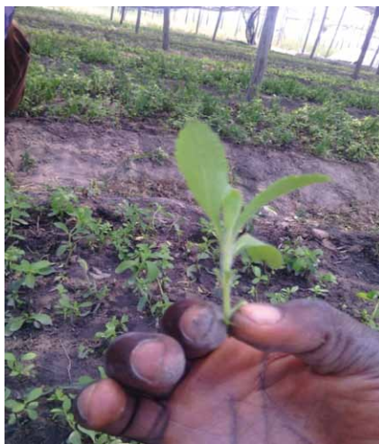
Forme de terreau

Les boutures coupées sont transplantées le même jour sur un sol aussi bien préparé que pour le semi. La bande est ainsi couverte de sachet transparent pour limiter l'évapo-transpiration. Après un mois, les boutures ont un système racinaire et sont prêtes pour la transplantation.