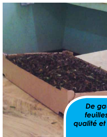
De gauche à droite, feuilles de mauvaise qualité et feuilles de bonne qualité