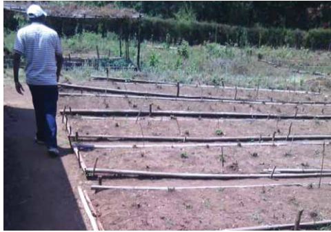
Forme de terreau