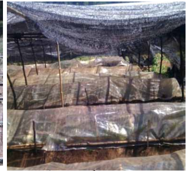
Aspect des semences